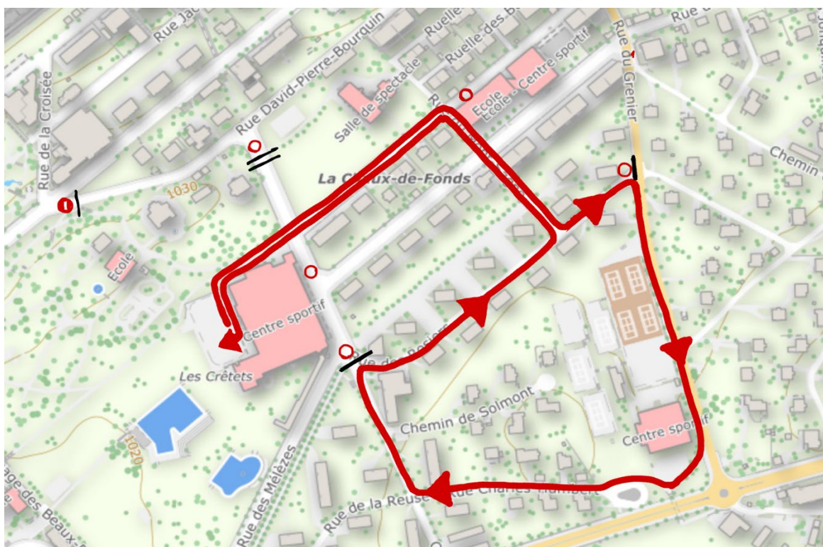
Perturbations entre 10h et 12h00 et entre 13h30 et 14h00 (parcours vélo enfants)